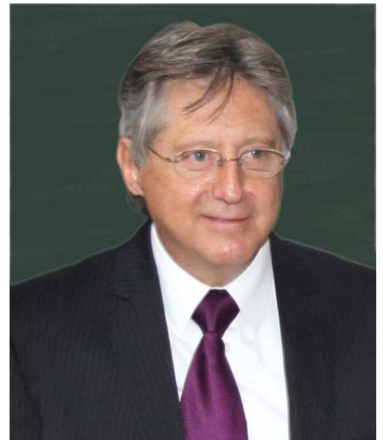
Premio Nacional Juan Pablos al Mérito Editorial 2013

Ha sido promotor de la institucionalización de la organización que dirige, y está convencido de que los logros que han alcanzado son de mérito colectivo. Sin embargo, hemos conocido su implicación personal en varias de las tareas de la editorial.